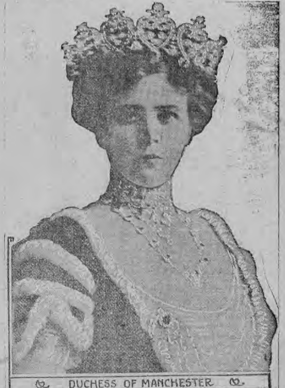
DUCHESS OF MANCHESTER