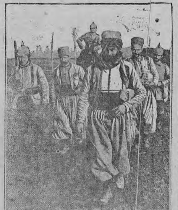
SENEGALÉSE SOLDIERS, PRISONERS OF GERMAN