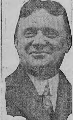
CHARLES S. WHITMAN

WHITMAN BECOMES NEW YORK GOVERNOR NEW YEAR'S DAY.